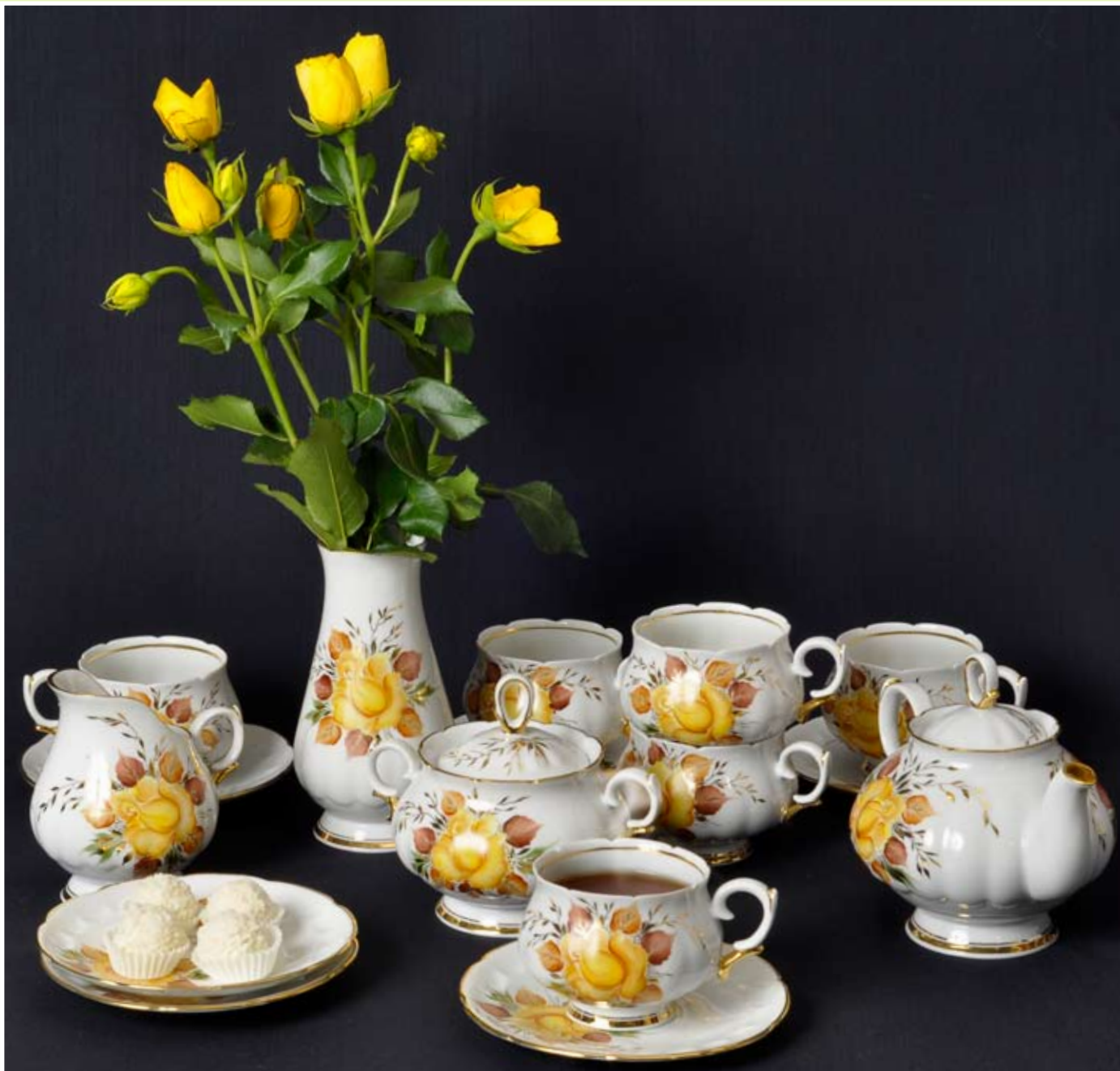
Сервиз «Агидель», 16 предметов, рисунок «Очарование»