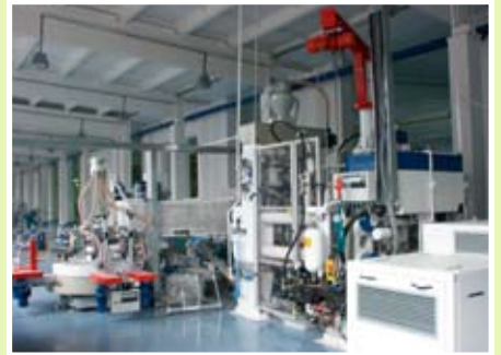
Цеха по производству фарфора