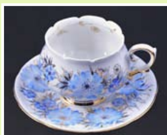
Рисунок «Зимний рассвет»