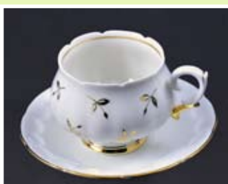
Рисунок «Золотая веточка»