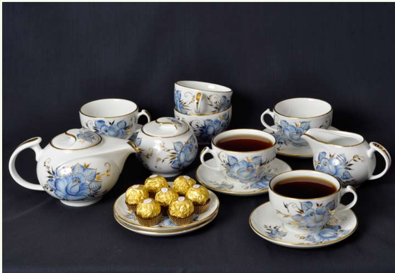
Сервиз «Восточный», 15 предметов, рисунок «Роза кобальтовая»

Завод выпускает чайные сервизы на базе формы «Агидель» (тонкостенный фарфор ручного литья) и формы «Восточный» (ресторанный фарфор). Сервизы расписываются вручную и могут состоять из нужного заказчику количества предметов.